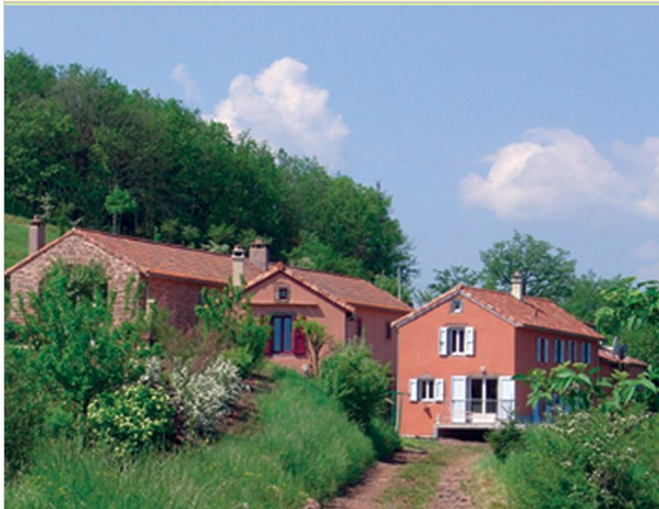
Chantefriboule - La Liquière Basse 12550 SAINT-JUÉRY